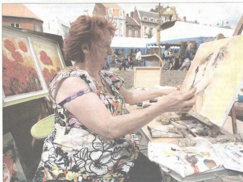
Certains peintres n'ont pas hésité à faire montre de leur savoir-faire.